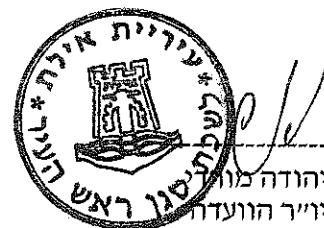
אנריאט זנו מזכירת הוועדה

אנריאט פועלת נמרצות ובחריצות עבור הנצחת החייל ונפגעי פעולות האיבה ואף עבדה קשה מאוד בכדי להשיג את הכסף לחידוש האנדרטה וחידוש התמונות ועל כך הנני מודה לה.