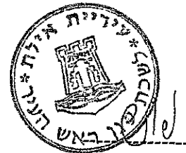
יהודה מורדי יו"ר הוועדה